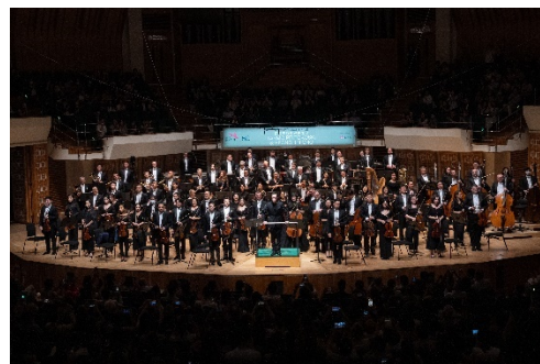
香港管弦樂團